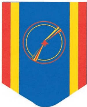
Panglica gradului de Ofițer