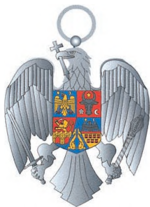
Gradul de Cavaler Avers