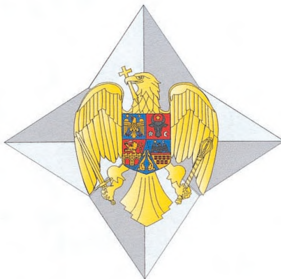
Placa gradului de Mare Ofițer