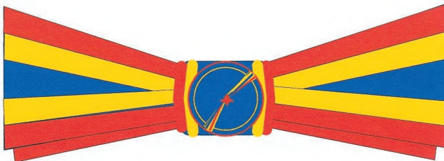
Funda pentru persoanele de sex feminin, gradul de Ofițer