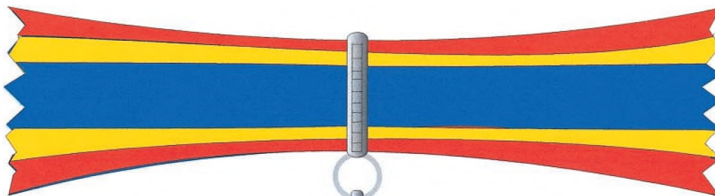
Panglica gradului de Comandor