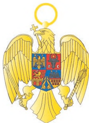
Gradul de Ofițer Avers