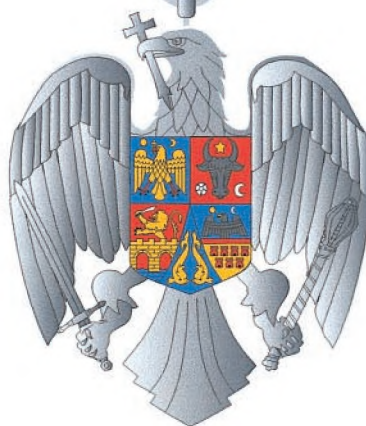
Gradul de Comandor Avers