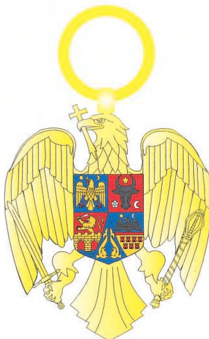
Însemnul gradului de Mare Cruce