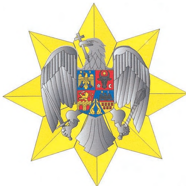
Placa gradului de Mare Cruce