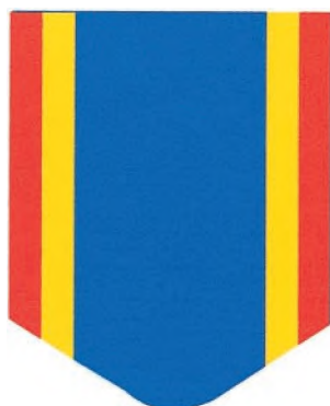
Panglica gradului de Cavaler